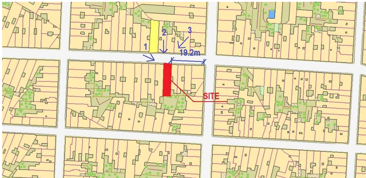
Figura 1: format tal-Pjan tas-sit

Il-pjanta għal kull applikazzjoni għandu jkollha l-format indikat f'Figura 1 hawn taħt, l-applikazzjoni tal-proprjetà partikolari għandha tkun sfumata bl-aħmar.